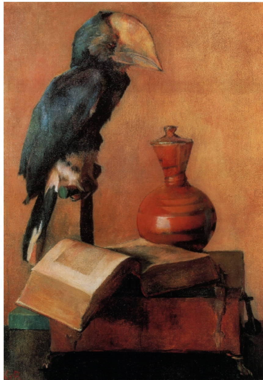
Maleri af Karen Blixen fra begyndelsen af 1920'erne: Næsehornsflugt, Krukke og Holbergs "Danmarks Riges Historie" . Karen Blixen Museet